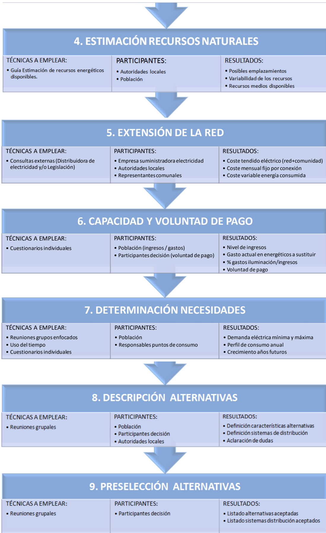
Figura A2. Técnicas, participantes y resultados de la caracterización parámetros del entorno