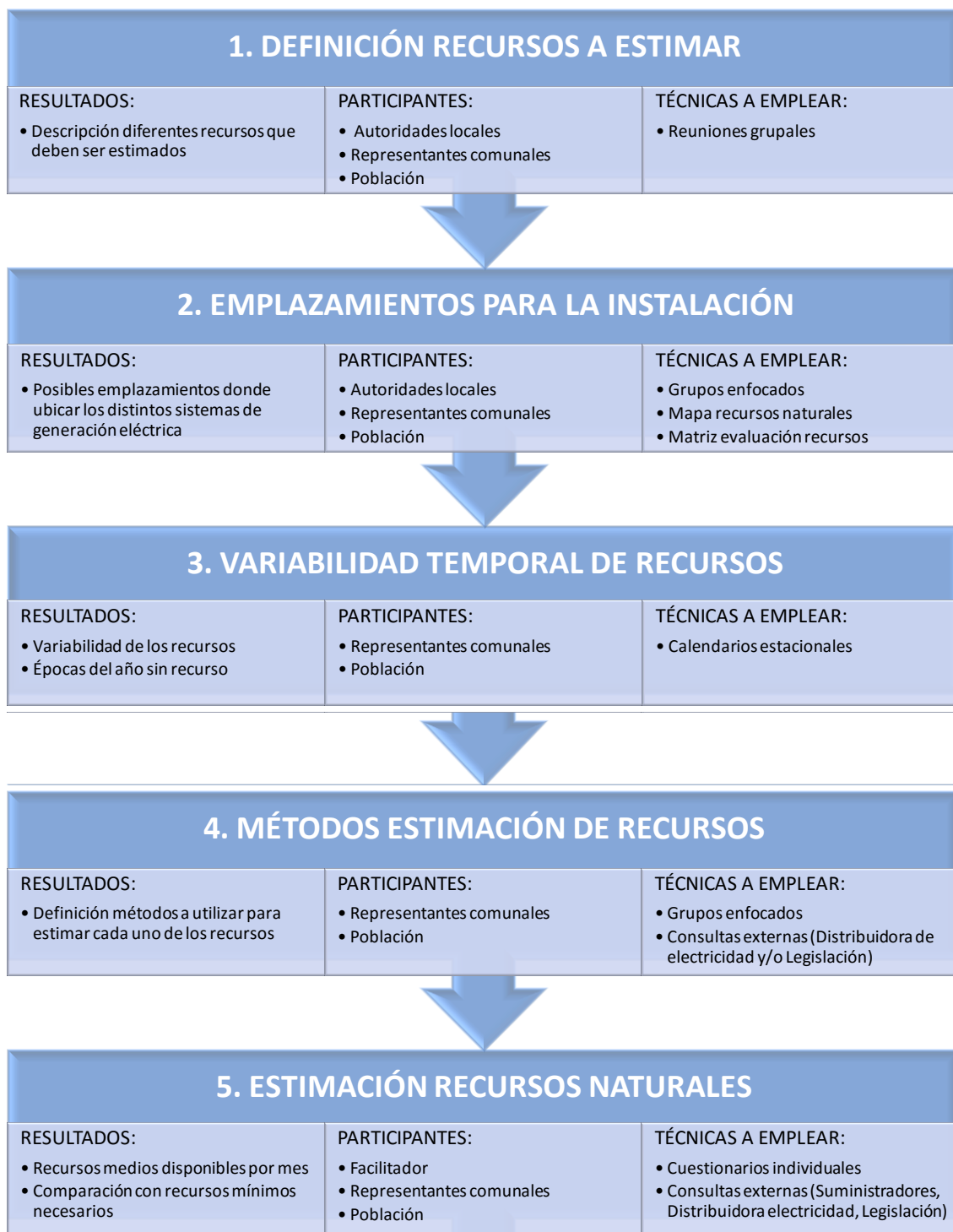
Figura A3. Técnicas, participantes y resultados de la caracterización de los recursos naturales