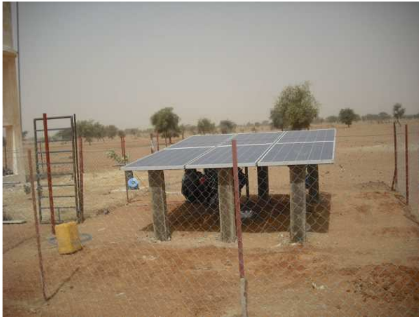
CAMPO DE PANELES FOTOVOLTAICOS